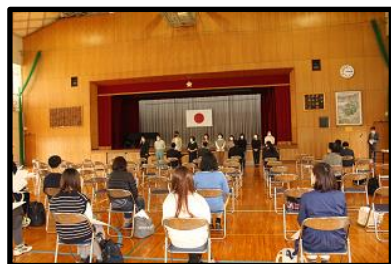
< P T A 総会の様子 >

PTA総会では、令和3年度の行事と活動報告、令和4年度の行事計画と予算がそれぞれ賛成多数で承認されました。また、来年度のPTA会長・副会長選出方法と地区委員の構成・選出方法の変更について審議され、承認されました。本年度も、新役員さんを中心にPTA活動を進めていきたいと思ます。この1年、有意義なPTA活動が展開されますよう、ご協力をお願いいたします。