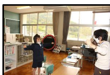
< 参観授業の様子 >