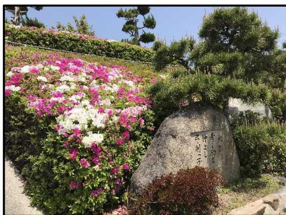
<校訓碑周辺のツツジ>

今月も、学校、家庭、地域の連携と協力を大切にして児童一人一人が自分のよさを伸ばしていけるようにしていきたいと思っています。どうぞよろしくお願いします。